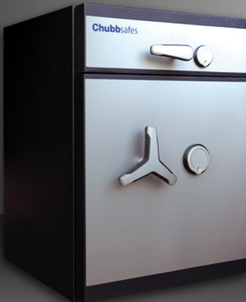
Abbildung: Modell Chubbsafes ProGuard DT II 60