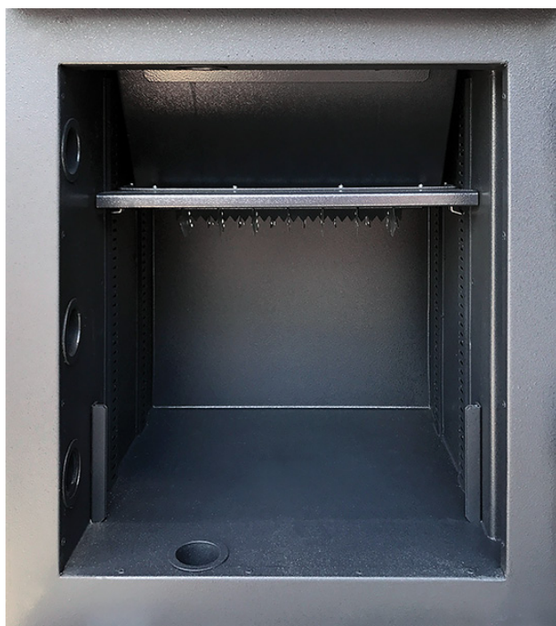
Innentresorraum ohne vertikale Trennwand