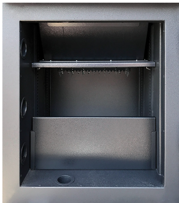
Innentresorraum mit vertikaler Trennwand